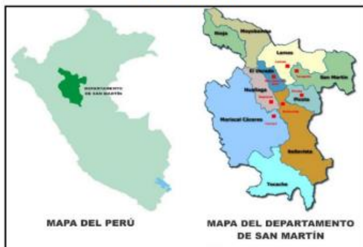
MAPAS DE UBICACION

Localidad : Huimbayoc Distrito : Huimbayoc Provincia : San Martín Región : San Martín