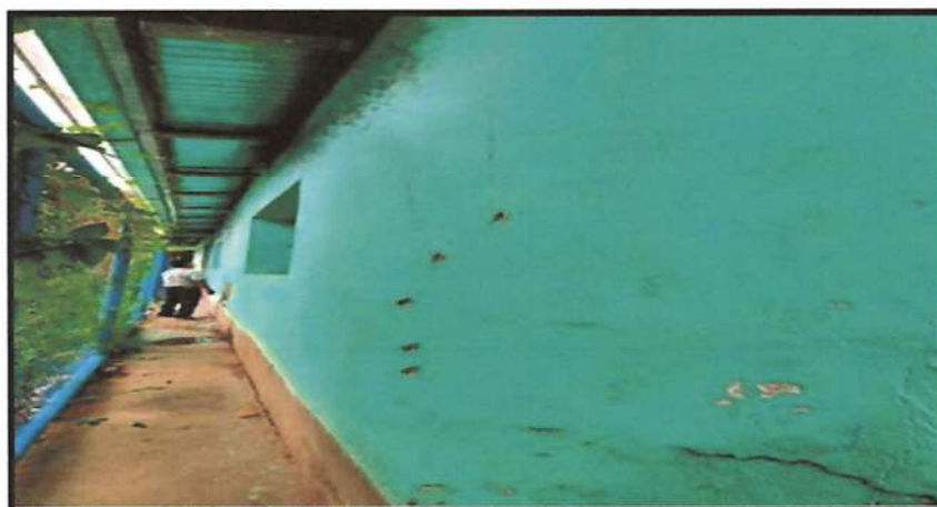
Foto: 01 Vista de paredes de Área Administrativa en condiciones de falla.