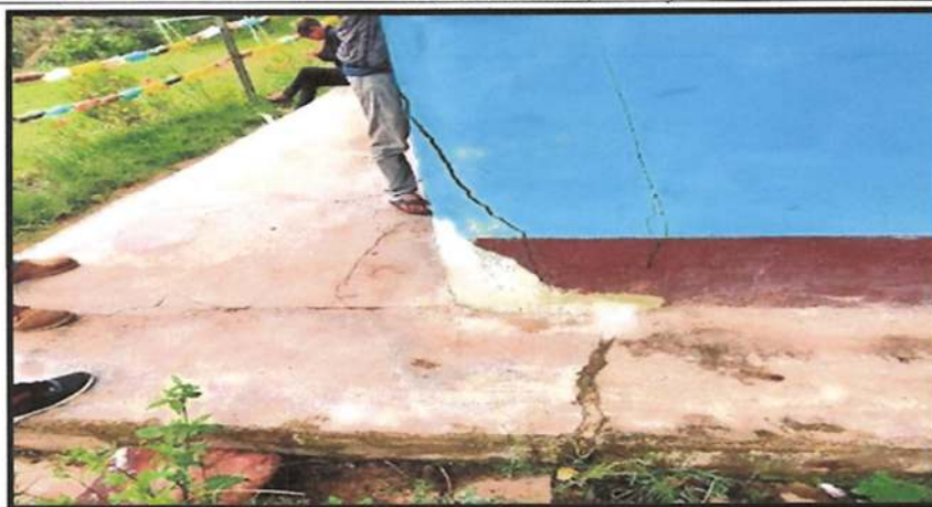
Foto: 02 Vista de pared exterior fallada.

"Año de la Unidad, la Paz y el Desarrollo"