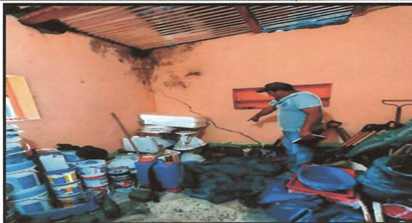
Foto: 02 Presencia de Rajaduras, en pared de adobe.

“Año de la Unidad, la Paz y el Desarrollo”