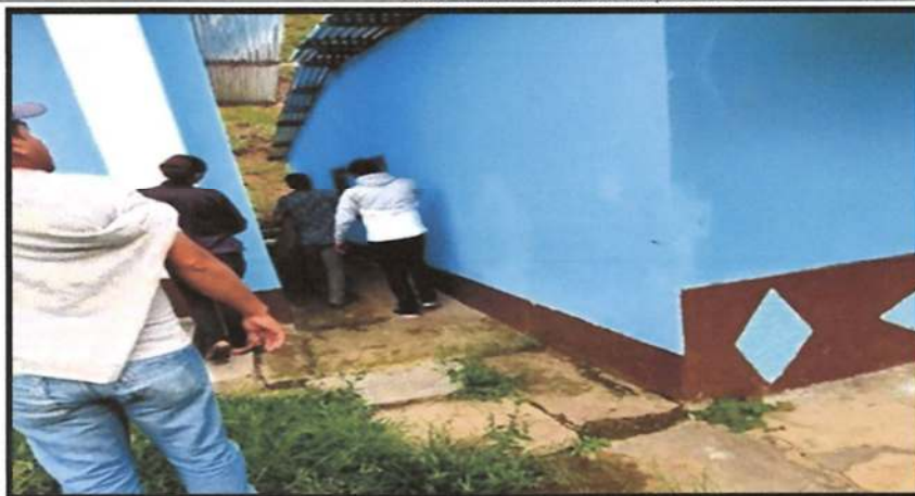
Foto: 04 Vista de veredas, pisos en mal estado.

"Año de la Unidad, la Paz y el Desarrollo"