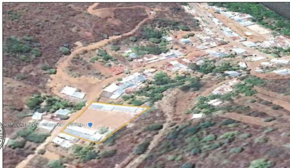
IMAGEN SATELITAL UBICACIÓN DEL PROYECTO