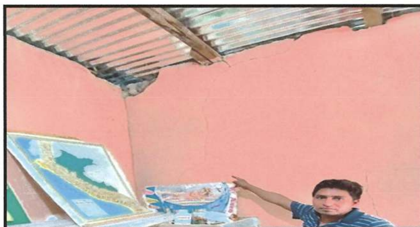
Foto: 03 Vista de Desprendimientos de parte de pared en aula.