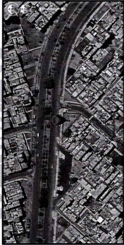
Ubicación del Predio N° 01