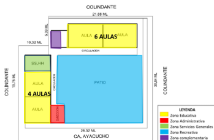
Imagen 02: Zonificación de ambientes

La I.E. N° 80404 se encuentra edificada en un terreno de 756.50 m 2 . Cuenta con 10 aulas, servicios higiénicos para niñas, dirección, escalera y un patio, todos construidos de material noble con una antigüedad mayor a 25 años.