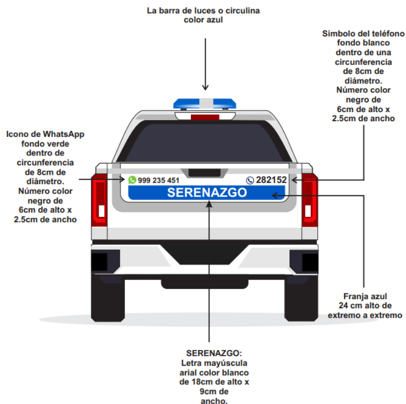
Gráfico 03: LATERAL