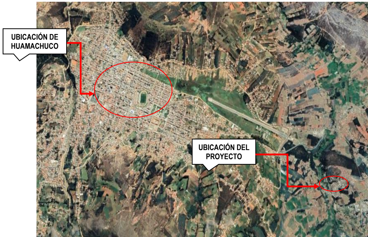
Imagen N° 05: Ubicación del proyecto en el Caserío El Toro