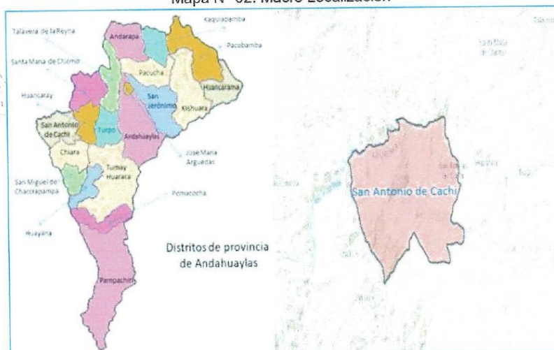
Mapa N° 02: Macro Localización