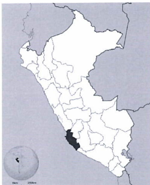
Gráfico N° 1: Ubicación Geográfica del Departamento y Provincia de Ica Macro localización del Distrito de Ica.

En el centro poblado Tacaraca, del distrito de Pueblo Nuevo, Provincia de Ica, Departamento de Ica. Este proyecto beneficia también a toda la población del Distrito de Pueblo Nuevo, Provincia de Ica, Departamento de Ica.