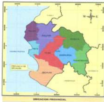
Imagen 02 – Mapa de ubicación Provincial