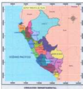
Imagen 01 – Mapa de ubicación departamental