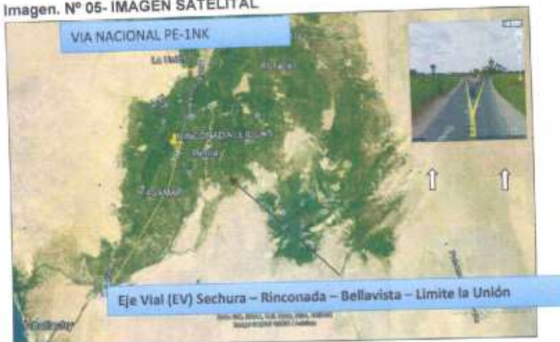
Imagen. N° 05- IMAGEN SATELITAL

Para acceder a las zonas donde se ubican los canales, se realiza a través de trochas carrozables a nivel de estado natural en regular estado de conservación. El tiempo promedio tomando como inicio los cruces de la Carretera Rinconada Llicuar – Sechura a los canales es de aproximadamente 15 minutos en automóvil.