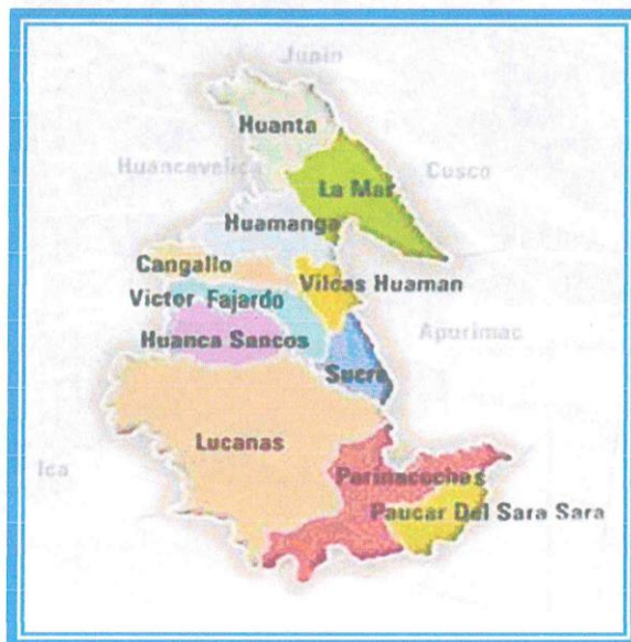
Mapa N°03 Ubicación del Distrito de Santillana