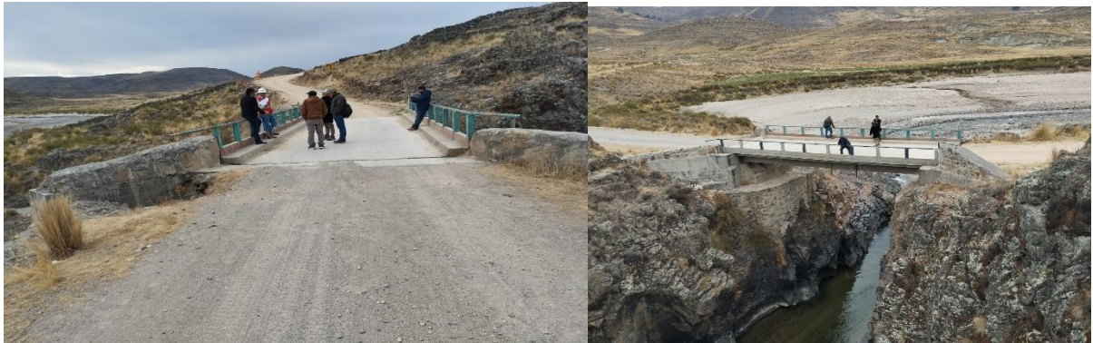
Imagen actual del puente

El estado actual del puente se encuentra con deficiencia, los estribos no cuentan con zapatas necesario en una posible colmatación del río, su ubicación está en la parte más angosta del río y tiene una antigüedad de 30 años aproximadamente, también no cuenta con vereda de peatón, no cuenta con aletas, no cuenta con la losa de aproximación y no cuenta con señalizaciones necesarias.