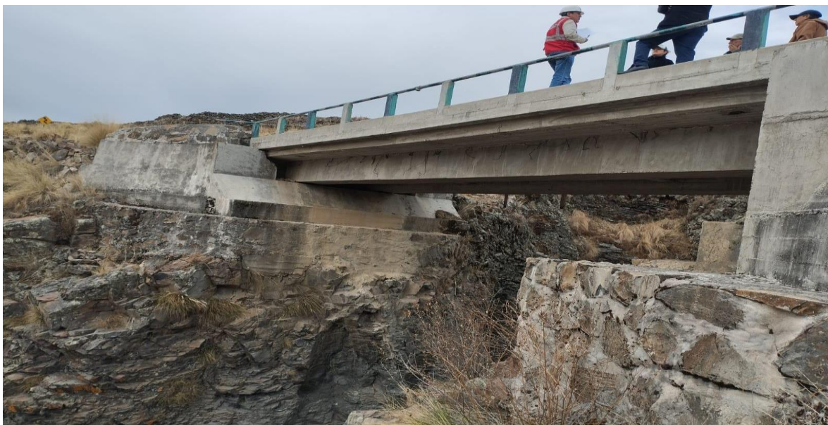
Vista de estribos y vigas

La longitud del puente Pampa Vehicular será de 20 m. medidos entre ejes de apoyos