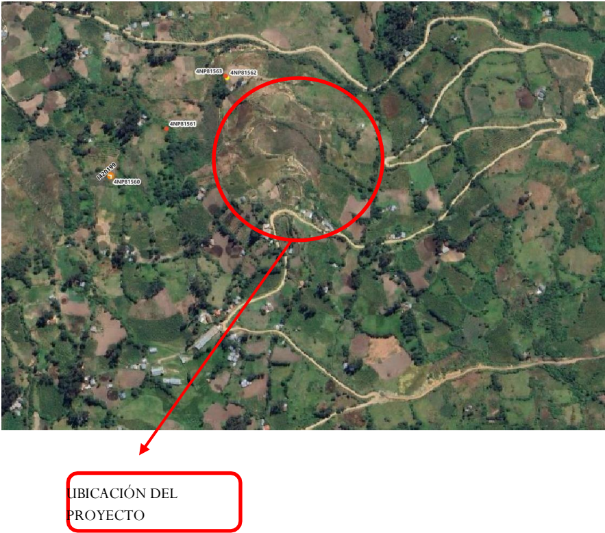
Fig. N° 03: Ubicación del Proyecto

La principal vía de acceso a la zona de ejecución del proyecto es lo siguiente:Mediante vía terrestre se tienen la siguiente alternativa: