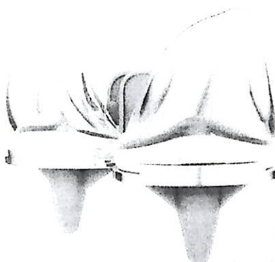
Prótesis total de rodilla cementada.