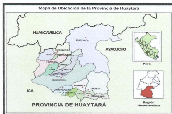
Figura N° 01: Localización De La Zona De Estudio Dentro De La Región Huancavelica