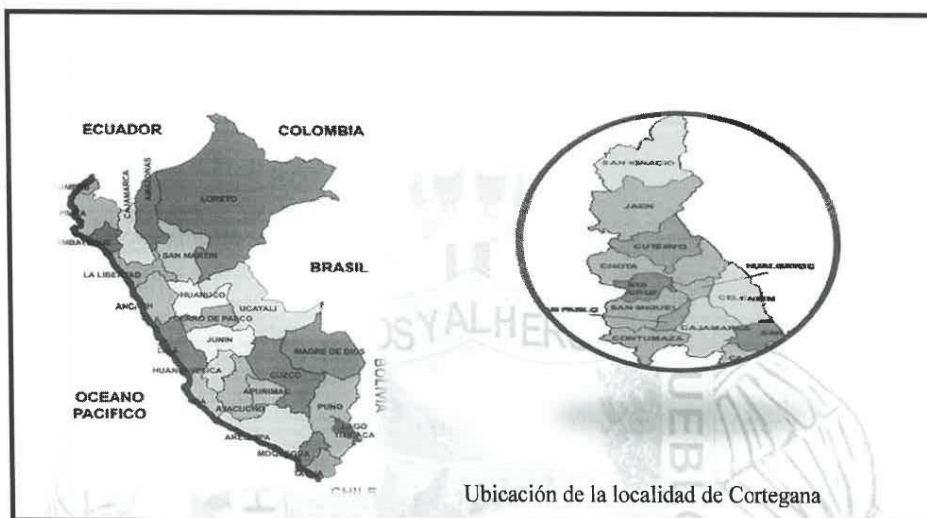
Ubicación de la localidad de Cortegana