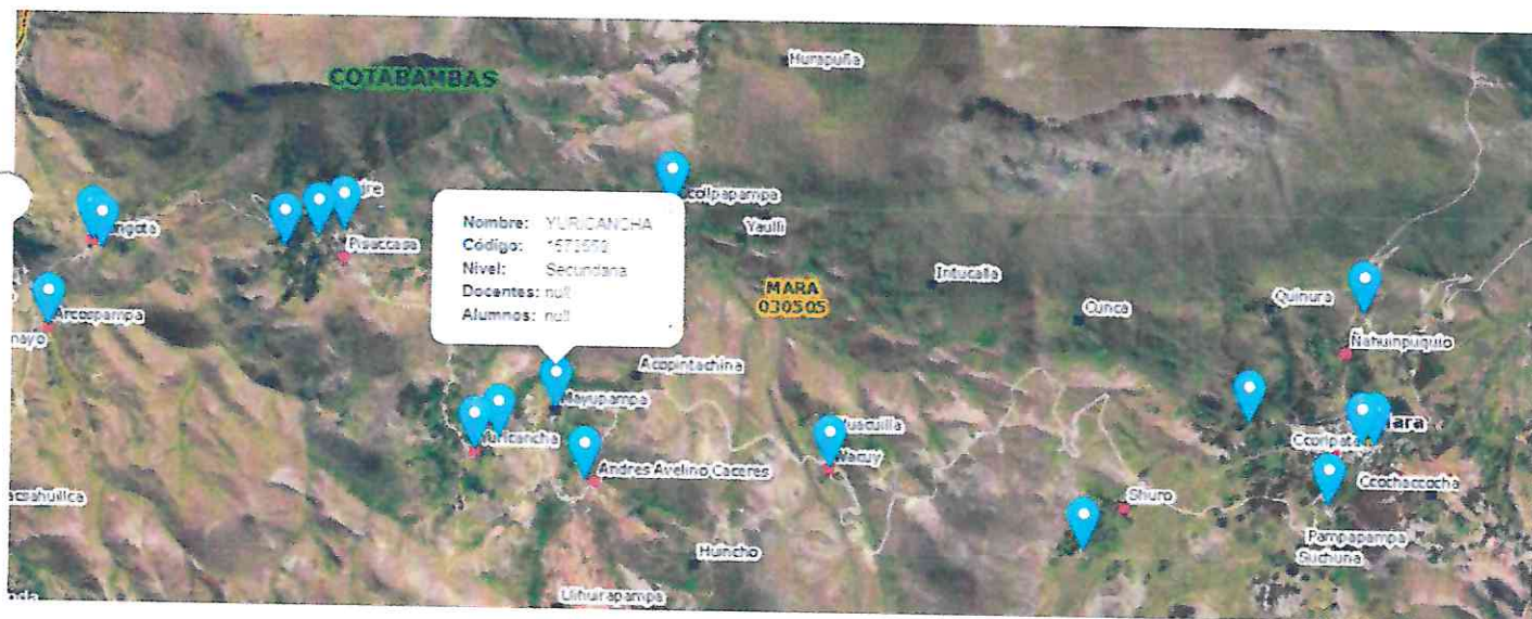
Comunidad de Yuricancha