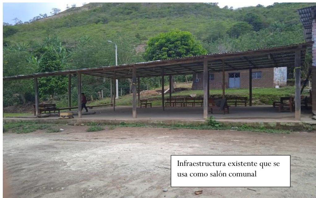
Infraestructura existente que se usa como salón comunal

El Caserío de San Andres cuenta con un espacio construido por la población de manera improvisada y sin ningún criterio de diseño construida en un terreno con un área de 228m 2 y 64 ml de perímetro que está ubicado frente al campo deportivo de dicho caserío.