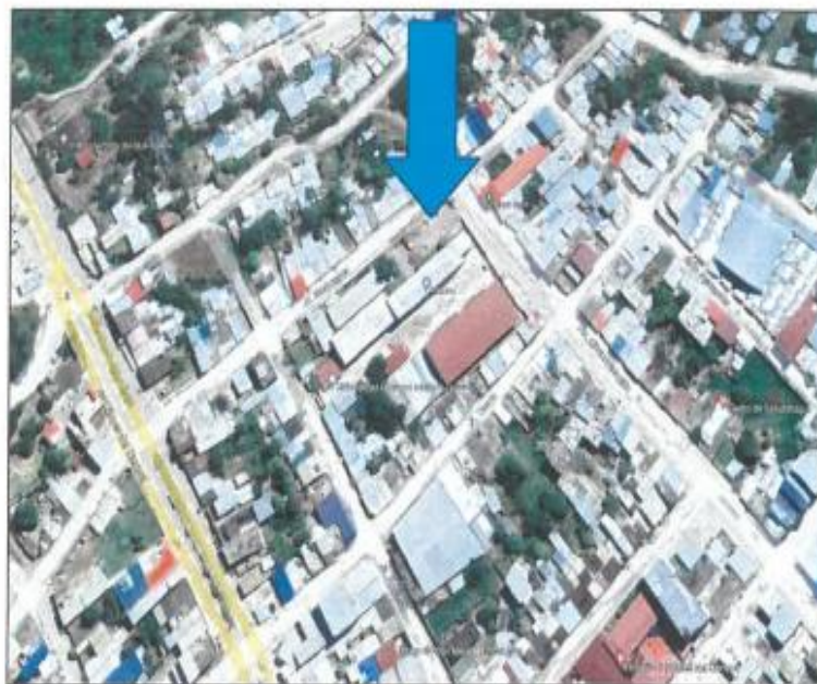
Vista aérea de ubicación del proyecto