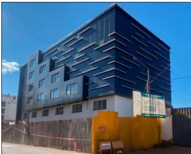
Centro de Monitoreo de Seguridad Ciudadana. Ubicado en la Av. Alemania Federal 1238, distrito de San Sebastián, Cusco.

El lugar de entrega será en la obra: “MEJORAMIENTO, AMPLIACIÓN DE LA PRESTACIÓN DEL SERVICIO DE SEGURIDAD CIUDADANA Y SERENAZGO EN EL DISTRITO DE SAN SEBASTIÁN, PROVINCIA DEL CUSCO - CUSCO” .