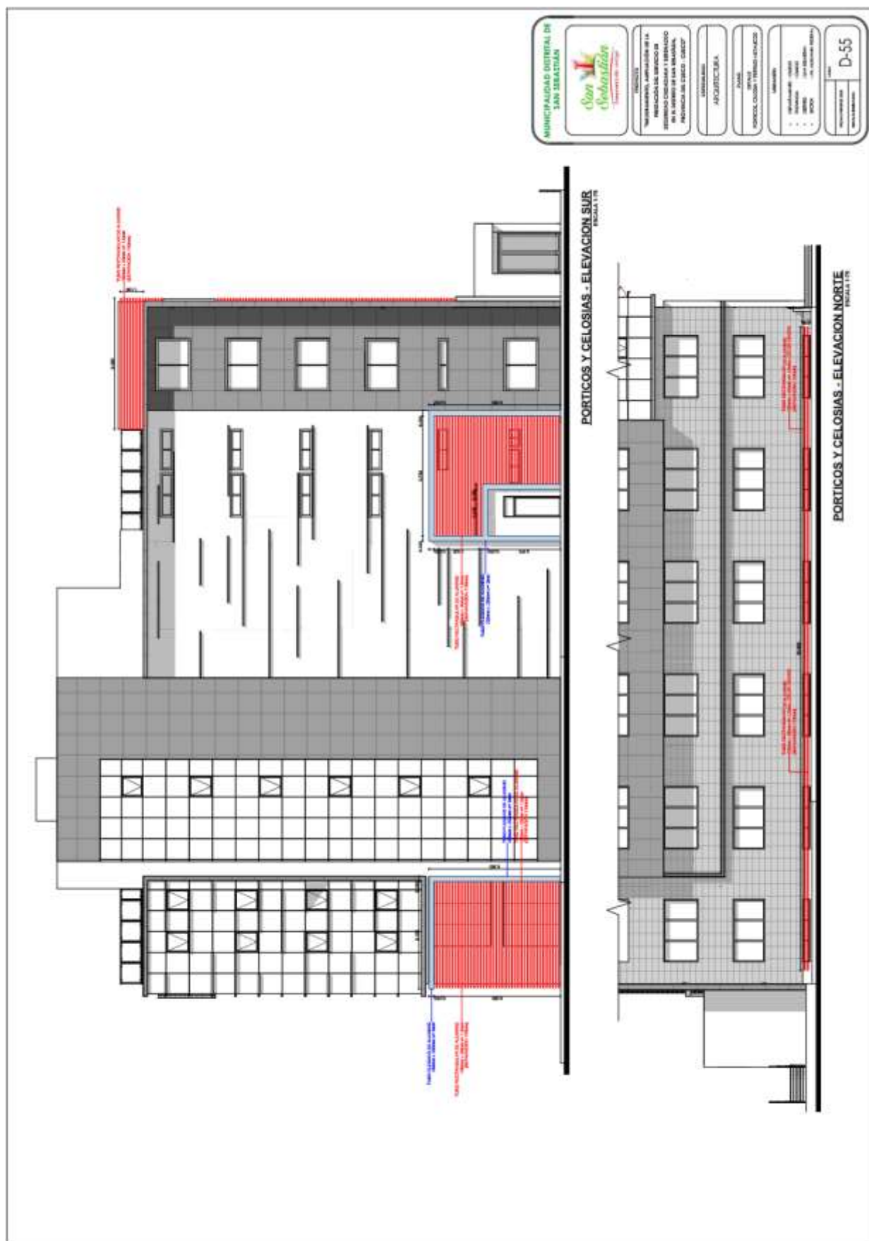
Planos de detalles pórticos, celosías y perfiles metálicos (Ver anexo de planos)