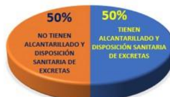
Gráfico 2: Urpish tiene una cobertura de alcantarillado y disposición sanitaria de excretas del 50%.

La localidad de Urpish tiene una población de 220 habitantes de los cuales 88 habitantes no cuentan con agua potable y 110 habitantes no tienen alcantarillado o disposición sanitaria de excretas, para estas personas desatendidas se plantea mejoramiento y ampliación de los servicios.