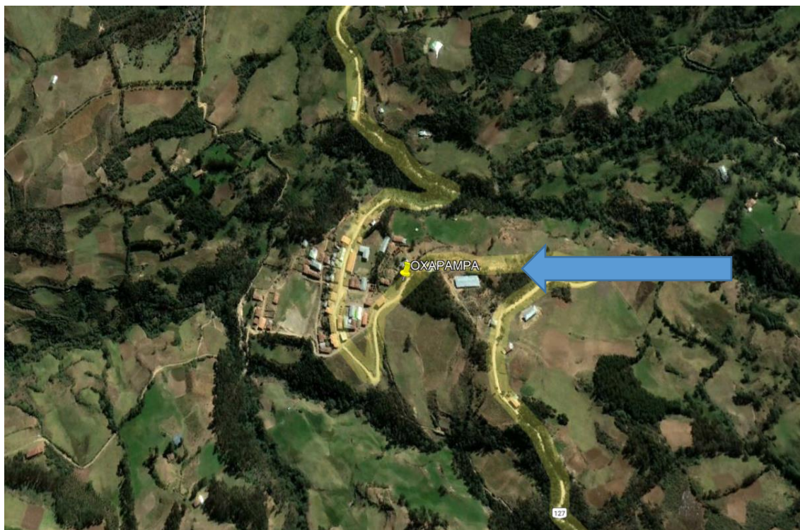
Ubicación Geográfica del lugar donde se proyecta la edificación.

Imagen N° 1: Ubicación y localización (9°094,867.00 N, 223,019.00 E)