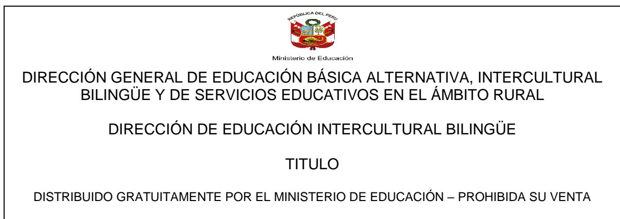
FIGURA N° 03