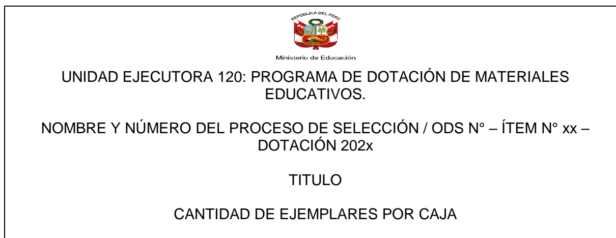
FIGURA N° 04