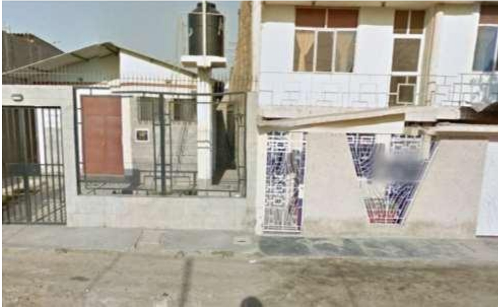
Ilustración N° 7. CALLE CONGRESO - Cuadra 04– superficie de rodadura actual