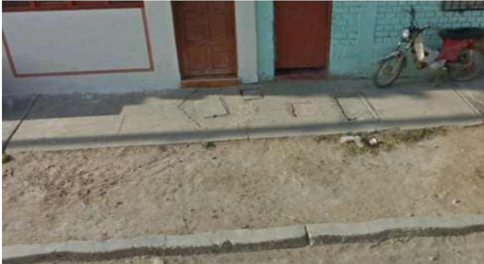
Ilustración N° 23. CALLE CHICLAYO- Cuadra 01– margen, Izquierdo, Vereda de tránsito peatonal en mal estado con presencia de grietas y sin respetar criterios técnicos, de acuerdo a la evaluación realizada en campo.