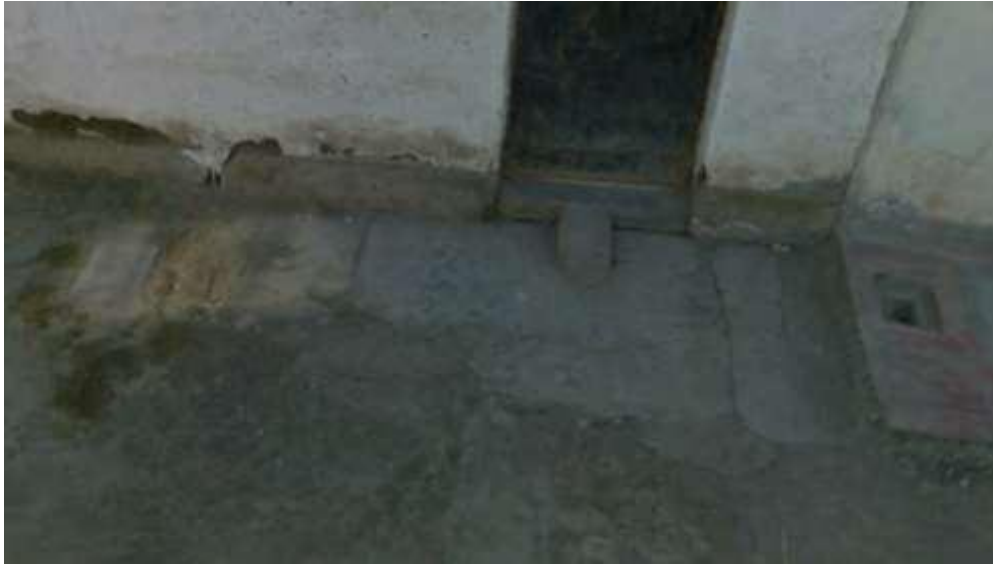
Ilustración N° 11. CALLE EL CARMEN -Cuadra 02– Vereda margen Derecho