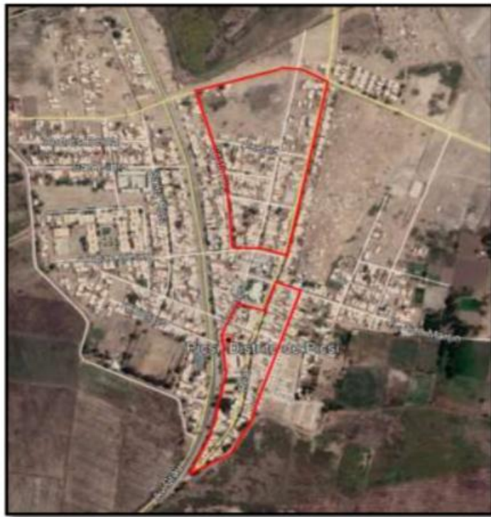
Ilustración N° 3. VISTA SATELITAL DEL PROYECTO

Para llegar a la localidad de Pícsi partiendo de la capital del departamento existe una ruta de acceso.