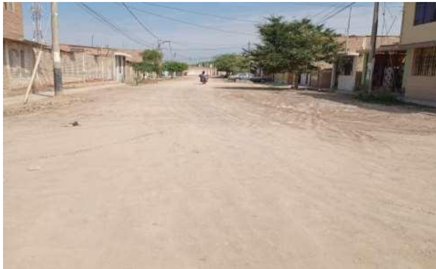
Ilustración N° 17. CALLE AGUSTO B. LEGUIA -Cuadra 01– Vereda margen Derecho