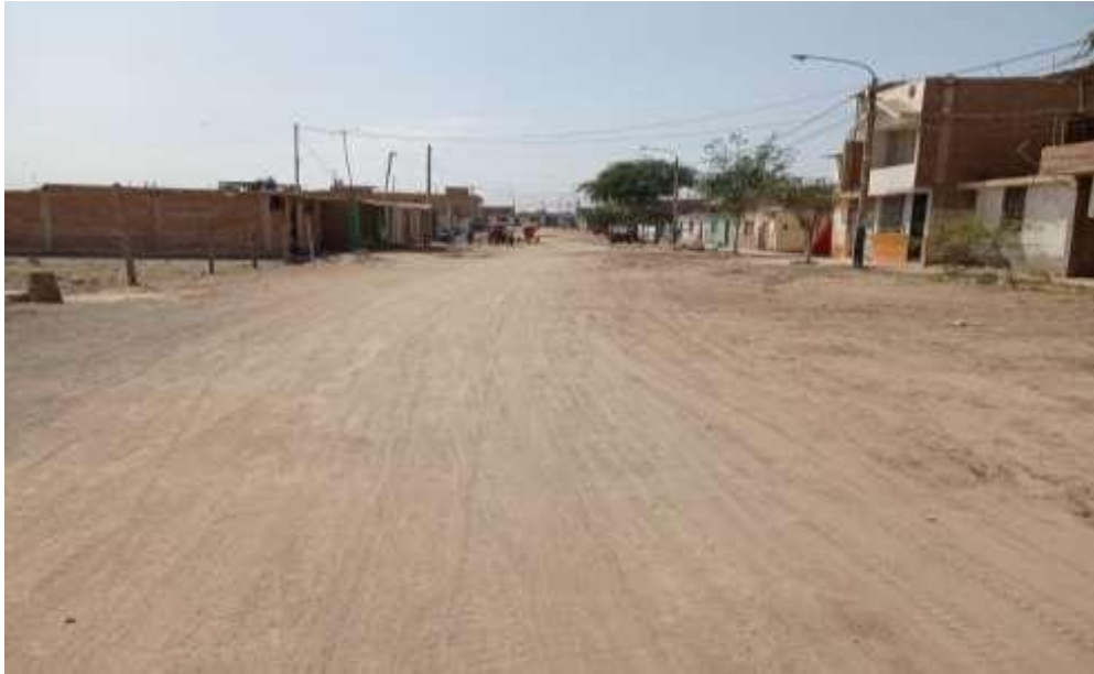
Ilustración N° 13. CALLE PUCALA -Cuadra 02– Sardinel y Vereda margen Izquierdo