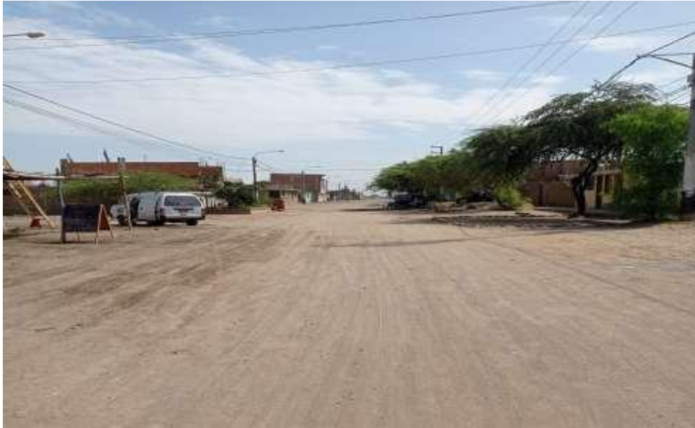
Ilustración N° 9. Calle Real- Cuadra 01- Vereda margen Derecho.