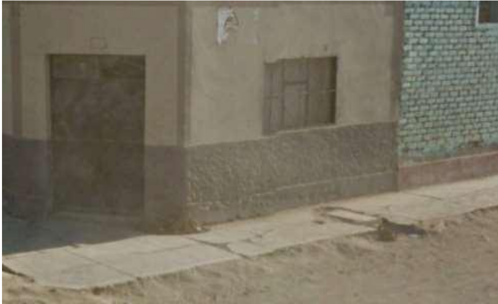
Ilustración N° 19. CALLE TUPAC AMARU-Cuadra 02– Vereda margen Derecho