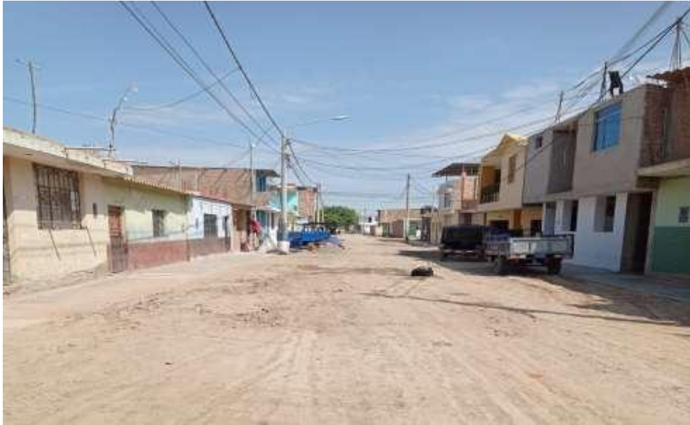
Ilustración N° 21. CALLE ELIAS AGUIRRE - Cuadra 03– margen, Izquierdo, Vereda de tránsito peatonal en mal estado con presencia de grietas y sin respetar criterios técnicos, de acuerdo a la evaluación realizada en campo.