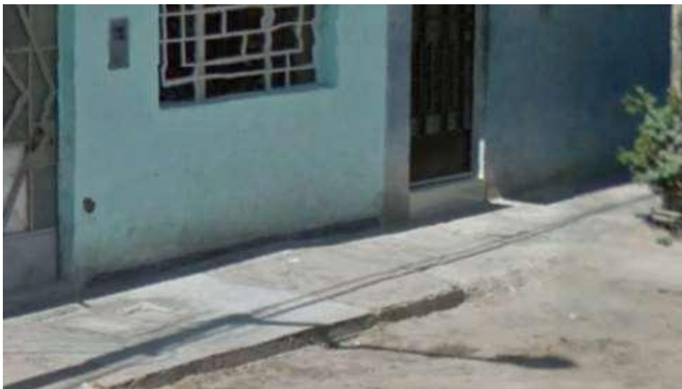
Ilustración N° 25. Calle SAN JUAN– margen Derecha, Vereda de tránsito peatonal en mal estado con presencia de grietas y sin respetar criterios técnicos, de acuerdo a la evaluación realizada en campo.