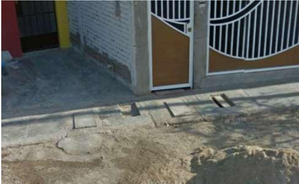
Ilustración N° 15. CALLE SIMON BOLIVAR -Cuadra 01– Vereda margen Derecho