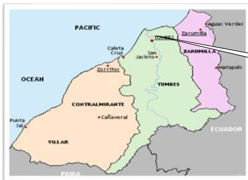
Ubicación en la Región