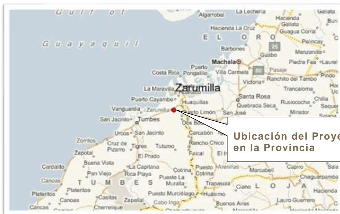
Ubicación del Proyecto en la Provincia