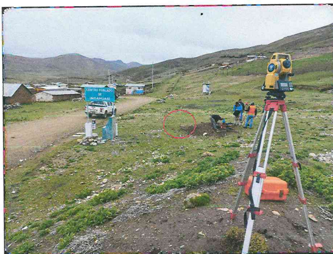
Imagen 1: Micro Localización del proyecto