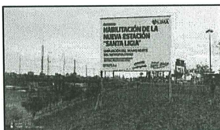
Imagen referencial N°04