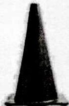
CONO DE SEGURIDAD