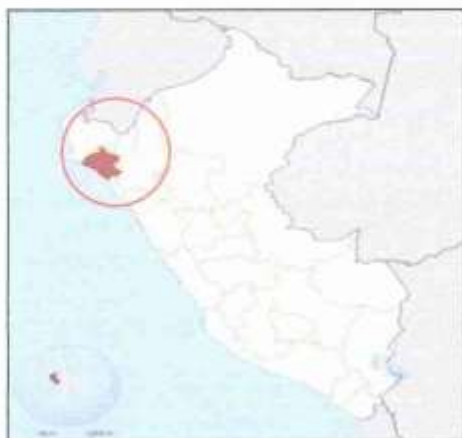
Figura 02: Mapa provincial de Lambayeque.