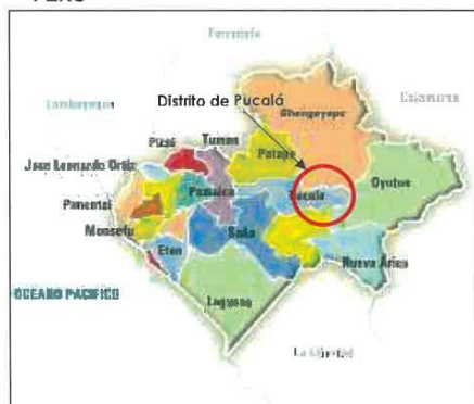
PROVINCIA DE CHICLAYO Y DISTRITO DE PUCALLÁ