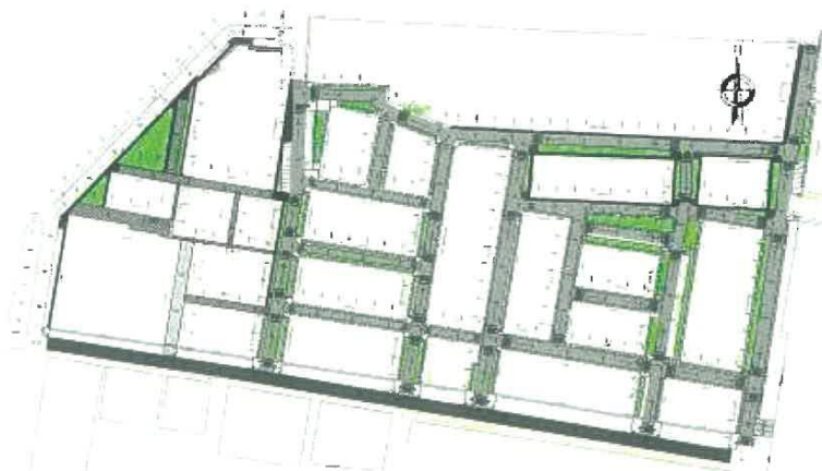
Planteamiento General Del Proyecto

Gerencia Regional de Infraestructura Dirección de Estudios y Asistencia Técnica