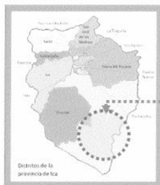
UBICACION PROVINCIAL - ICA

Micro Localización del Proyecto – Nivel Provincial / Nivel Distrital