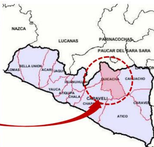
MAPA N° 1. 1 DE