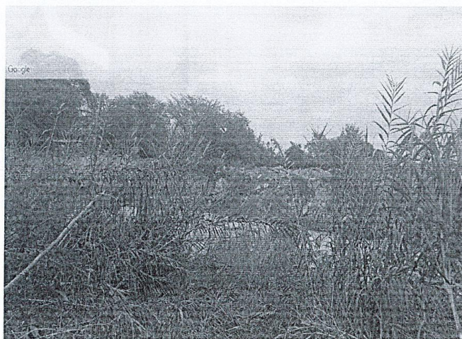
Foto 02: ubicación de acceso al tramo I margen derecho del río Yapatera, el cual se encuentra con presencia de vegetación para el acceso provisional al puente modular Yapatera a instalar.