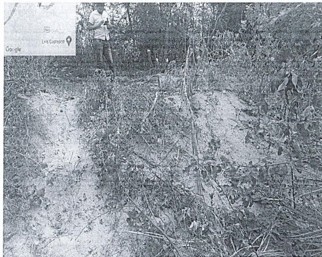
Foto 03: ubicación de acceso al tramo II, punto donde se accede por el AAHH Santa Rosa.