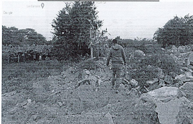
Foto 01: ubicación de acceso al tramo I margen izquierdo del río Yapatera, el cual se encuentra con presencia de vegetación para el acceso provisional al puente modular Yapatera a instalar.

"ACONDICIONAMIENTO DE ACCESO PROVISIONAL PARA PUENTE MODULAR SOBRE RIO YAPATERA; EN EL (LA) RUTA: CHULUCANAS-BATANES, DISTRITO DE CHULUCANAS, PROVINCIA DE MORROPON, DEPARTAMENTO DE PIURA".