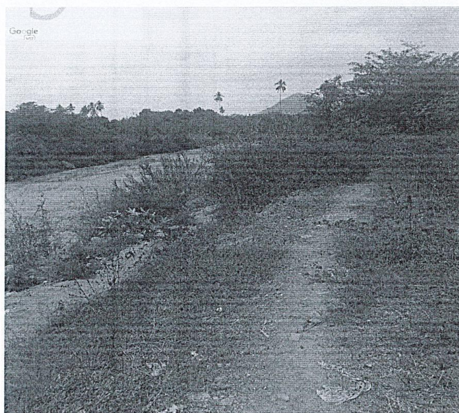
Foto 04: ubicación de acceso al tramo II, punto donde se accede por el AAHH Santa Rosa.