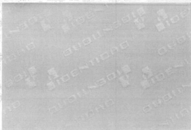
IMAGEN DE LA FILMINA DE SEGURIDAD