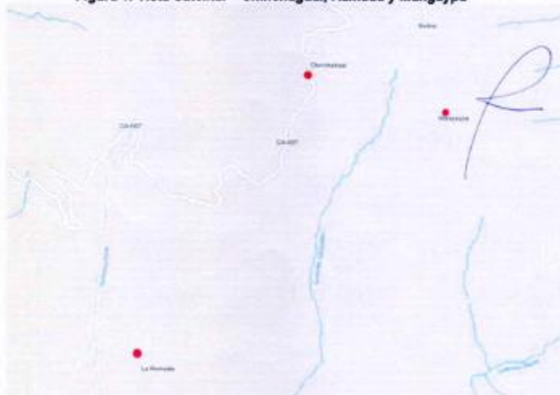
Figura 1. Vista Satelital – Chinchagual, Ramada y Mangaypa

ING. ROYBER GUERRERO DIAZ REG. CIP: 308609