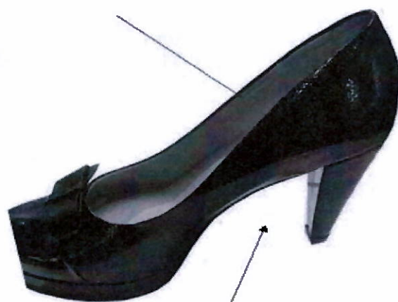
ZAPATO CORTE PRINCESA