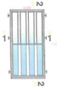
ALZADO DE PUERTA V-1