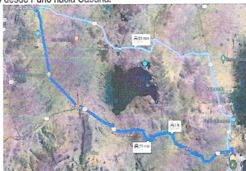
Figura N°3: Vías de Acceso desde Puno hacia Cabana.