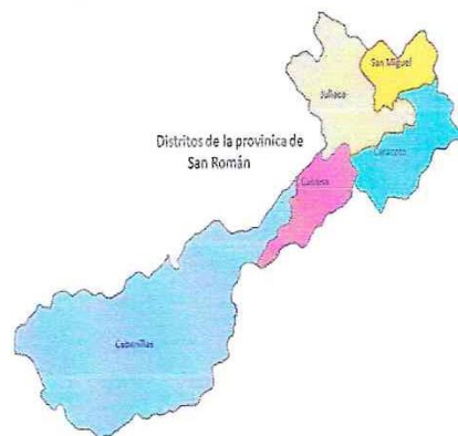
Mapa de Ubicación del Proyecto