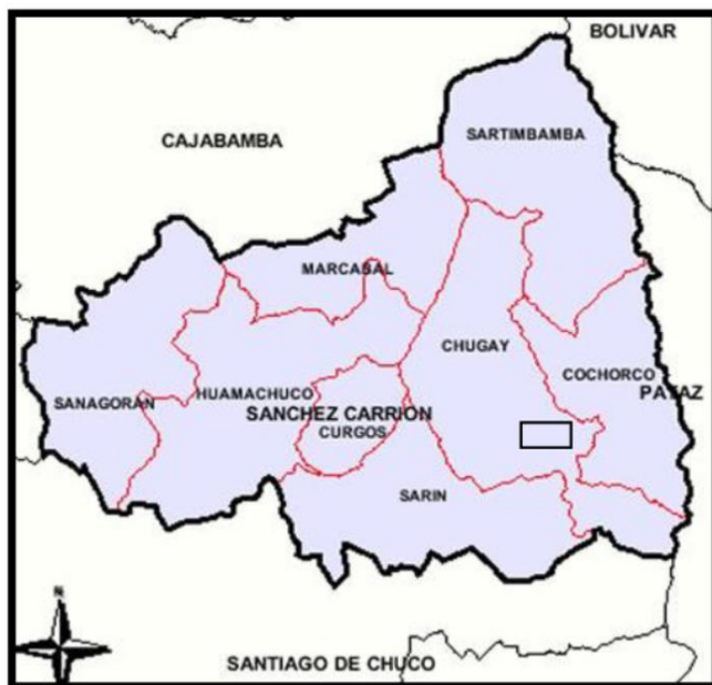
Distrito de Chugay en la provincia de Sánchez Carrión