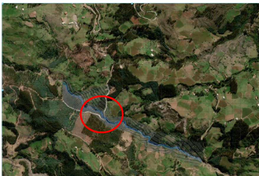
Centro poblado de Cochabamba en el Distrito de Chugay – Caserío Cashorco