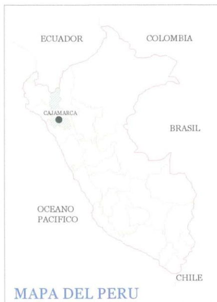
FIGURA N° 1: UBICACIÓN GEOGRÁFICA: PROVINCIA DE JAÉN