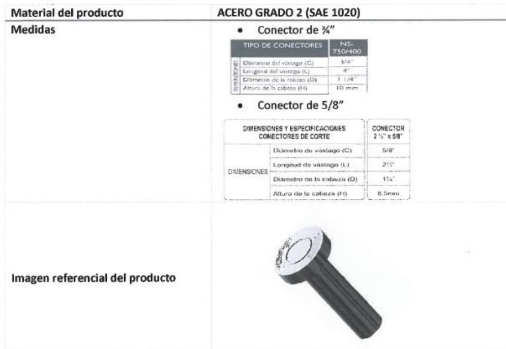
Tabla 02. Conectores de Corte de 3/4" y 5/8"