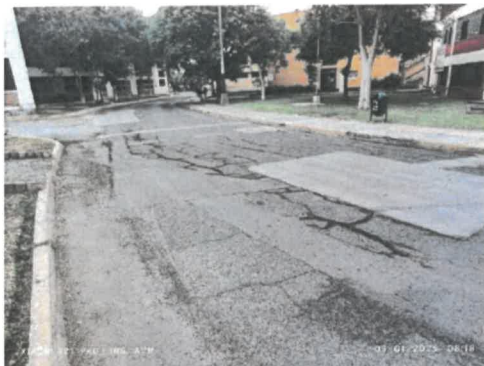
Figura 5 Reparaciones de concreto en mal estado (fracturado), ahuellamiento y boqueo