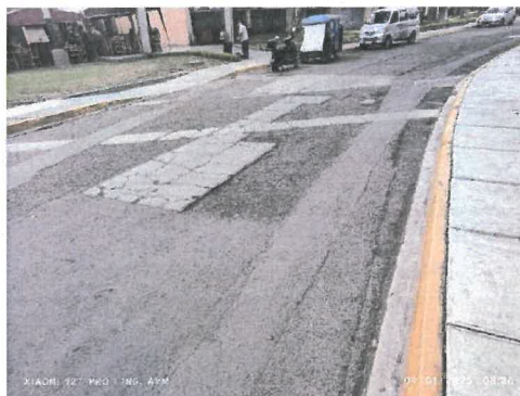
Figura 11 desintegración de pavimento asfáltico, reparación con concreto fracturado.