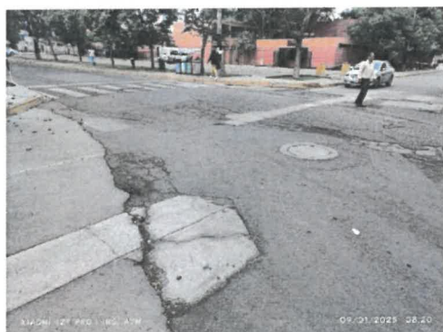
Figura 6 Reparaciones en concreto en mal estado, carpeta asfáltica desintegrada junto con piel de cocodrilo, agrietamientos