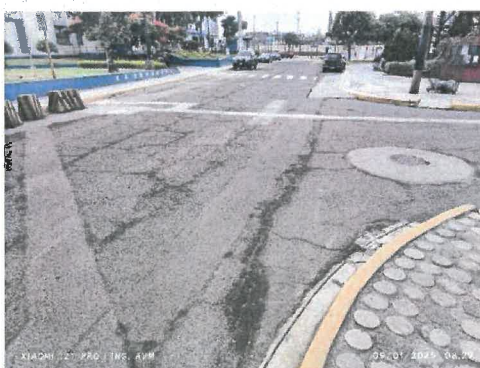
Figura 12 Agrietamiento, parches de trabajos de servicios y ahuellamiento.