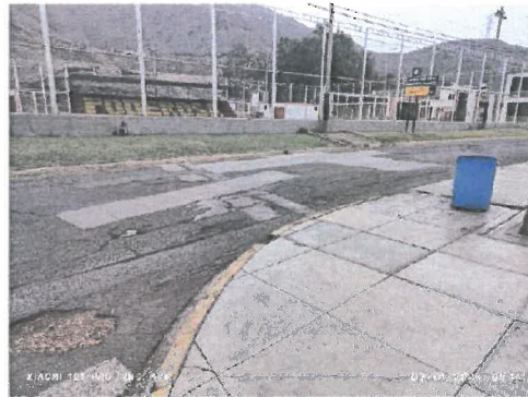
Figura 3 Reparaciones de concreto en mal estado (fracturado), ahuecamiento y bacheo.