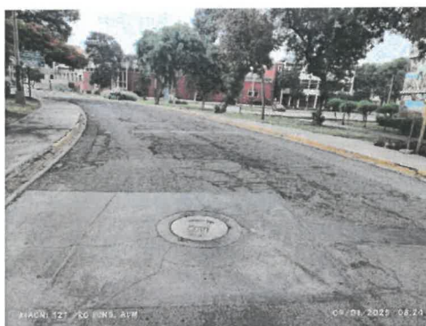
Figura 10 Piel de cocodrilo, ahuellamiento, reparación en concreto con agrietamientos.