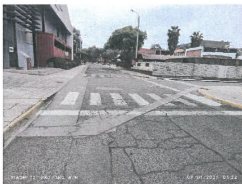
Figura 8 cruzadas en concreto en mal estado, falla en bloque parte central y agrietamiento longitudinal.