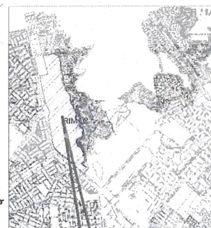
PROVINCIA: LIMA DISTRITO: FIMAC LUGAR: UNIVERSIDAD NACIONAL DE INGENIERIA AVENIDA: AV. TUPAC AMARU N°: 210