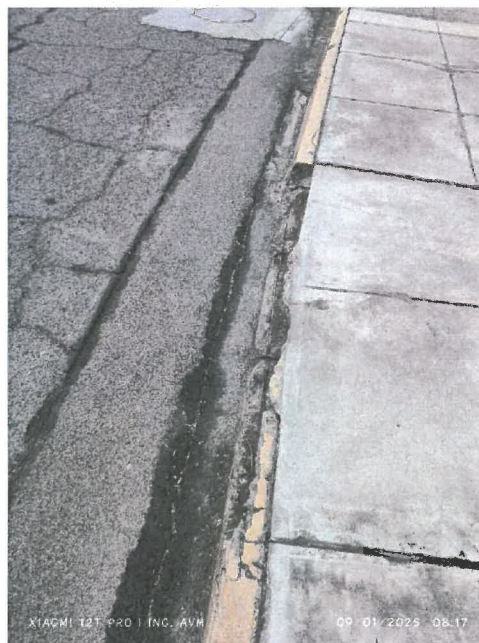
Figura 4 Agrietamientos longitudinales y desintegración de sardinel