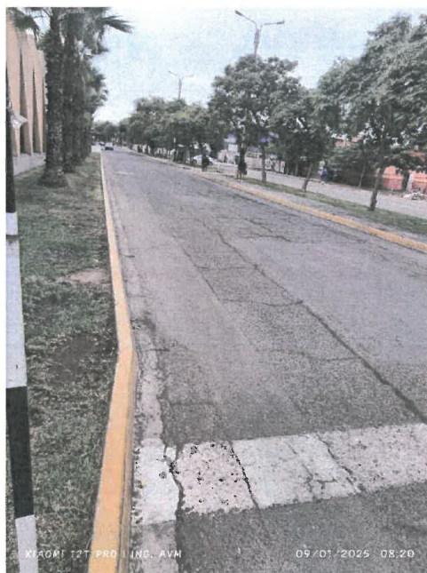
Figura 7 reparación antigua en mal estado, aluvellamiento y agrietamiento longitudinal