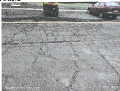
Figura 1 Piel de cocodrilo