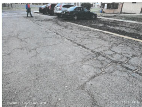
Figura 2 Piel de cocodrilo