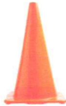
CONO DE SEGURIDAD