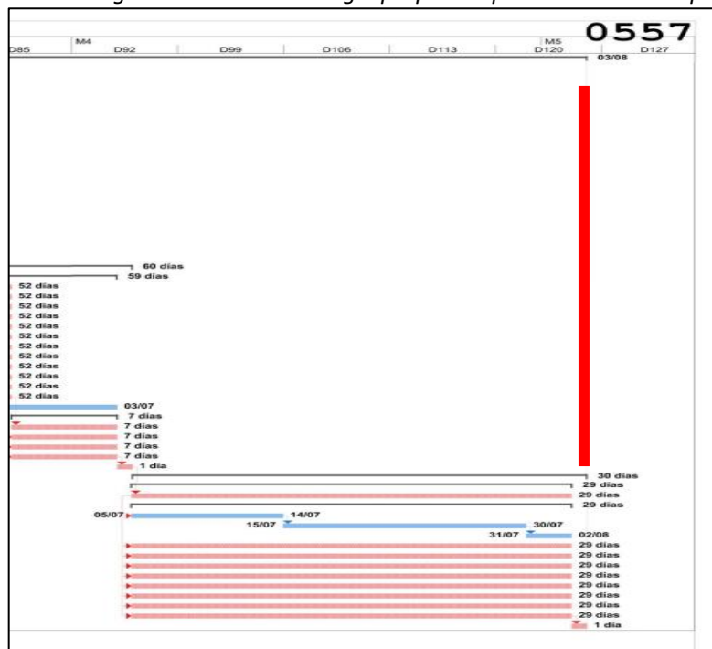
Gráfico del cronograma de la metodología propuesta por el Consorcio Impugnante.

Nota: Información extraída de la página 557 de la oferta del Consorcio Impugnante.