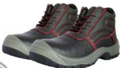
ZAPATOS DE SEGURIDAD TRABAJO – SEGURIDAD