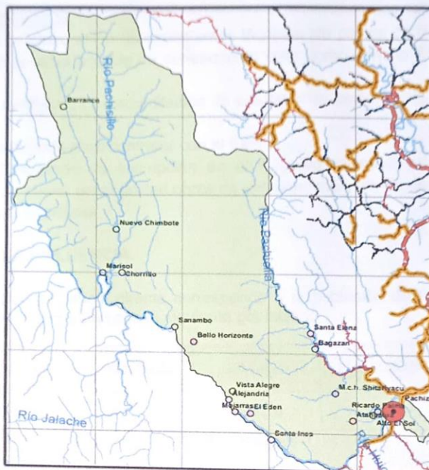
Gráfico N° 04: Localización del proyecto Localidad de Pachiza