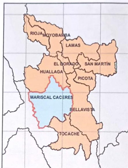
Gráfico N° 03: Localización del proyecto – Provincia de Mariscal Cáceres