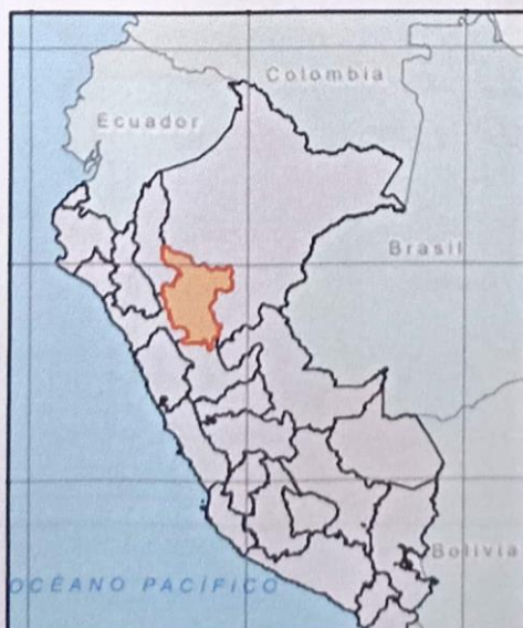
Gráfico N° 01: Localización del proyecto – País Perú