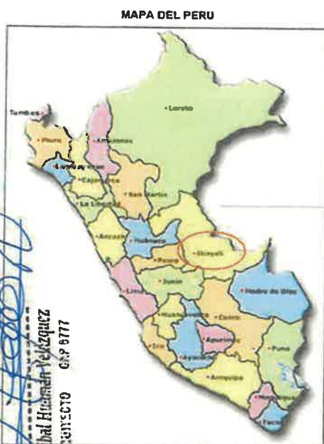
IMAGEN N° 02: EL PROYECTO DE INVERSION SE ENCUENTRA EN LA REGION UCAYALI, PROVINCIA DE CORONEL PORTILLO, DISTRITO CALLERIA