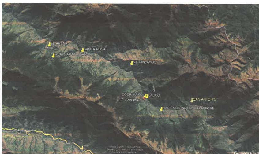
MAPA 04. Mapa del área de influencia del proyecto