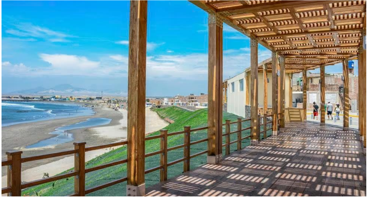
FUENTE: IMAGEN DEL MALECON TURISTICO DE PUERTO MALABRIGO