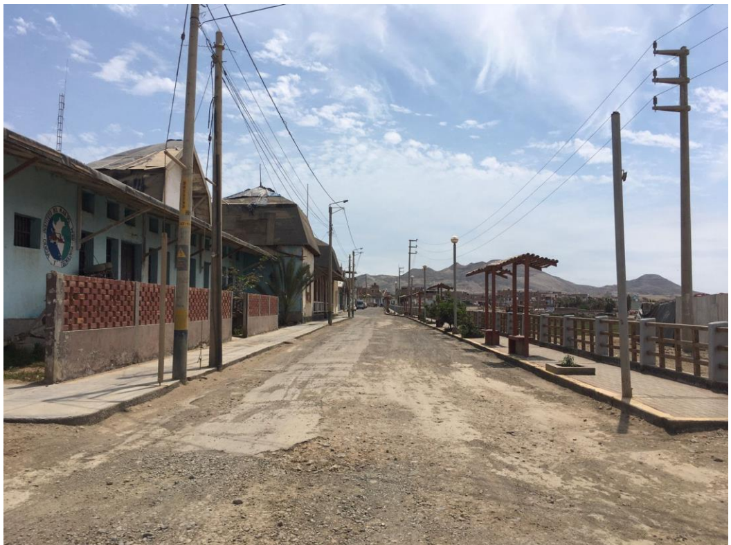
FUENTE: ESTADO SITUACIONAL DE PROLONGACIÓN TACNA