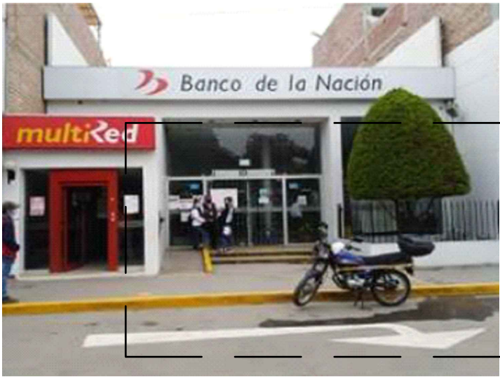
ESTADO ACTUAL - FOTO 2