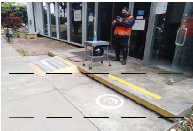
ESTADO ACTUAL - FOTO 1