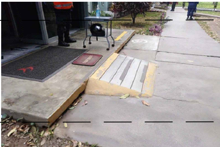
ESTADO ACTUAL - FOTO 2