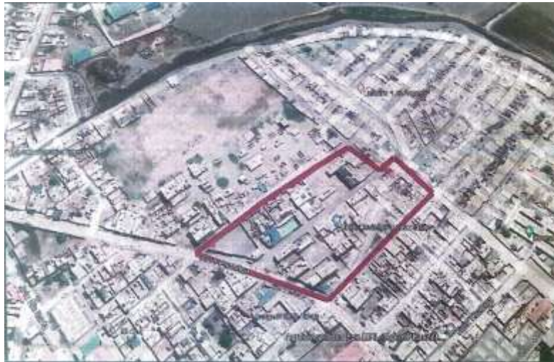
IMAGEN N°2: ÁREA DE INFLUENCIA DEL PROYECTO